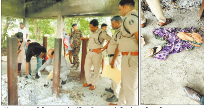
मौके पर जांच करती बिलासपुर आई फॉरेंसिक टीम। मृतक के चिता के पास मिला महिला कपड़ा व चप्पल।

बीते रविवार की रात शहर से करीब 10 किमी दूर एक गांव में ऐसी घटना घटी जिसने पुलिस और प्रशासन को भी परेशान कर दिया है। गांव की एक महिला के अपने पति के साथ जलती चिता में सती होने की घटना ने सबको चौंका दिया है। हालांकि पुलिस का कहना है कि सती होने का तरीका अलग है और यह महिला मिसिंग है। हालांकि चिता पर पास में कोई ऐसे चिन्ह नहीं मिल रहे जिससे लगे कि कोई दूसरा व्यक्ति भी इस चिता में जला है।