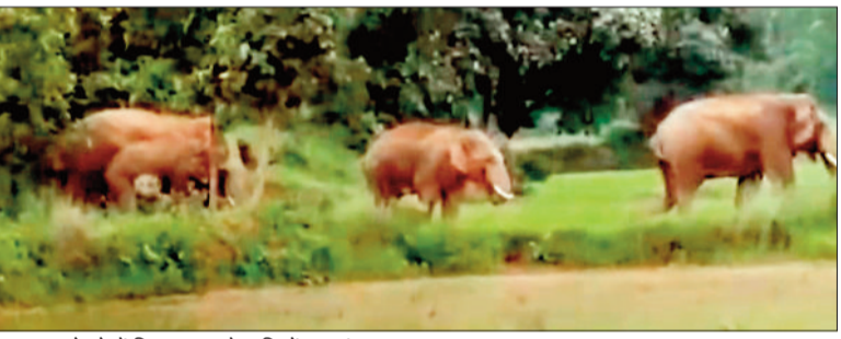
लोक बनकोम्बो में विवरण करते हाथियों का झुंड।