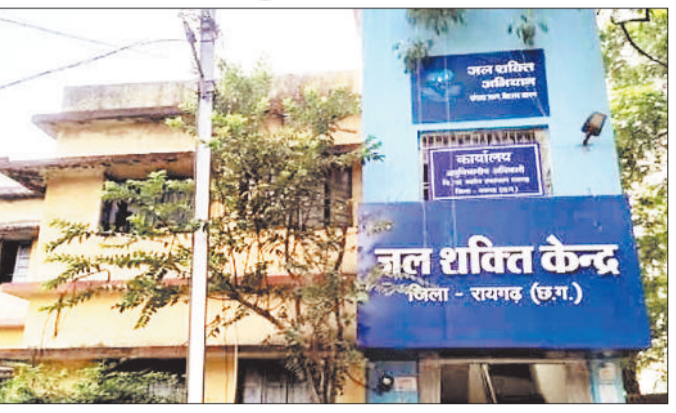
यह है नियम: जल संसाधन विभाग अपने ही नियमों को लागू नहीं कर पा रहा है। मासिक जलकर प्राप्त किया जाने से 30 दिन के अंदर कंपनी को भुगतान करना होता है। बिल की तारीख से तीन महीने के अंदर भुगतान नहीं करने पर 24 प्रेश ब्याज व एक प्रेश वार्षिक दर से शुल्क की वसूली की जाती है। छह महीने तक जलकर नहीं देने पर एग्जिट नोटिस होना माना जाता है।

जिले में भारी मात्रा में पानी की बर्बादी कर रहे उद्योग जल संरक्षण से विपरीत काम करते हैं। नियमों के तहत जो जलकर अधिरोपित किया जाता है वह भी नहीं चुकाया जाता। 2023 की स्थिति में जिले के करीब 75 उद्योग ऐसे हैं जिन्होंने जलकर ही नहीं दिया है। किसी का बकाया हजारों में है तो किसी को लाखों में और कुछ का करोड़ों में। इन उद्योगों को 194 करोड़ रुपए जलकर जमा किया जाना है। 51 उद्योग ऐसे भी हैं जो बिना अनुमति के ट्यूबवेल खनन कर भूजल दोहन कर रहे हैं।